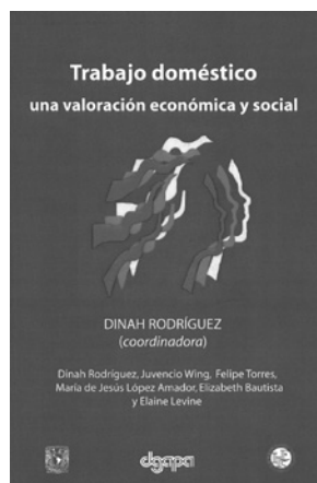
Dinah Rodríguez (coordinadora), et. al., Trabajo doméstico Una valoración económica y social , Instituto de Investigaciones Económicas, UNAM, México, 2009, 202 pp.

A través de seis ensayos se muestra la situación del trabajo doméstico, donde se evidencia lo poco analizado en las esferas académicas, quizá por el hecho de que ese trabajo siempre ha existido; siempre ha estado ahí, por más que sus manifestaciones sociales y su forma concreta hayan cambiado a lo largo del tiempo. Los criterios predominantes han desestimado la importancia de la actividad doméstica como parte de la vida cotidiana y se ve con desden, pues se considera que no vale la pena considerarlo como trabajo, ya que no implica una remuneración a quien lo lleva a cabo y los beneficiarios no pueden cambiar de proveedor de tales servicios, y las autoras de estos textos nos ofrecen otra forma de considerar al trabajo doméstico.