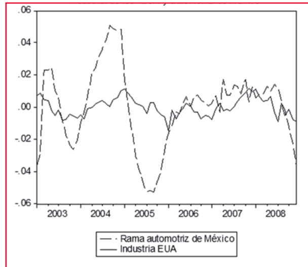
Gráfica 1 Componente cíclico de los índices de producción industrial de EU y automotriz de México

Por lo anterior, el análisis del comportamiento del ciclo manufacturero, mediante la comparación del componente cíclico de ambos países requiere de utilizar técnicas estadísticas para determinar las características de las series de tiempo de ambas economías. Lo anterior a fin de poder estimar el grado de correlación, de la volatilidad y de la persistencia de las fases del ciclo económico en ambos países.